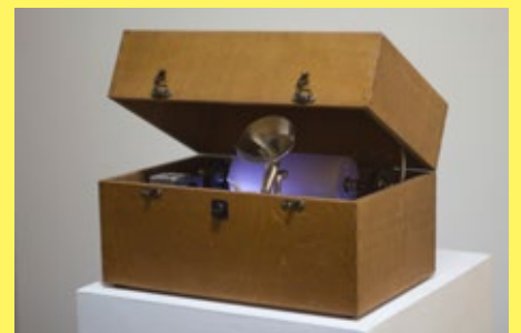
開箱作業系列 - 噪聲機 (開梱シリーズ - 騒音計) / Sound of Suitcase - Noise Box / 2014