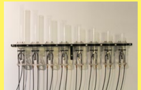
空・器 (空のデバイス) / Kong Qi / 2016