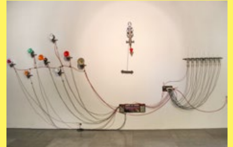
聲牆 (サウンドウォール) / Sound Wall / 2016