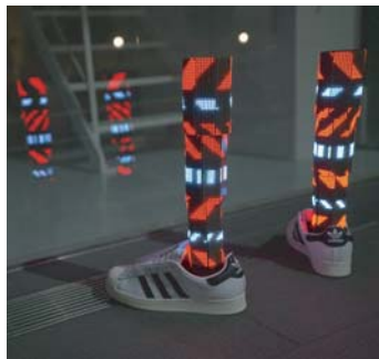
「Pixel Beings -Bboy-」Minoru Fujimoto