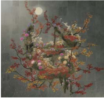
「生命は生命の力で生きているII」 チームラボ