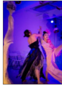
2020年10月初演時シリーズ『夢の浮橋』~源氏物語より~ 『第1章 苦悩の春』

[お問い合わせ] SPACE FACTORY 044-911-6573 / spacefactory.live@gmail.com