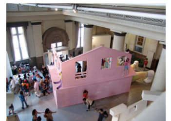
磯崎道佳「横浜かくれんぼ / ずっと野毛山あたり ~横浜市立東小学校と武井邸を巡って~」2004年5月22日~6月6日

横浜にゆかりのあるアーティスト、クリエイターのみなさまへ創造都市横浜20周年をみんなで祝いませんか？