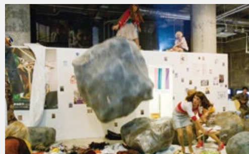
Cafe LIVE 2008/ 菊地容作