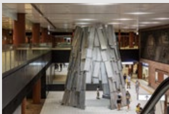
《都市への挿入 川俣 正》2020.9.11-10.11、BankART Temporary+ 馬車道