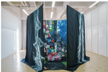
阿部零《Shqua is on your own way》