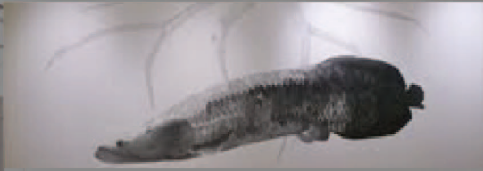
日本画「-Link-」 後藤 孝美